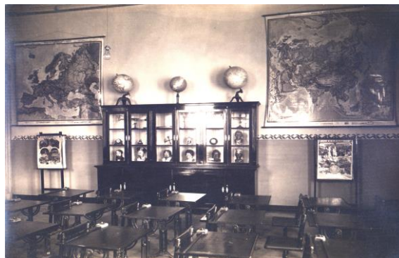
Imagem: Ginásio Paranaense, década 1940

Período: 25/03 a 24/06/2017 - Dia/horário: Sábados, das 9h00 às 12h00